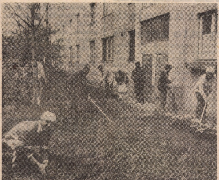
Spiritul gospodăresc al locuitorilor din cartierul sibian Hipodrom se concretizează și în această primăvară prin lucrări periodice de curățenie și întreținere a spațiilor dintre blocuri. În fotografie: instantaneu surprins zilele trecute în fața imobilului din Aleea Biruinței nr. 10 unde un grup de locatari se îngrijesc de înfrumusețarea spațiilor verzi

● Astăzi, ora 14, la Centrul de Creație și Cultură „Cîntarea României” al Sindicatelor Mediaș, va avea loc un concurs „Cine știe răspunde” avînd ca tematică „100 de ani de la moartea lui Mihai Eminescu”, iar la ora 17, la Clubul sindicatului „Independența” din Sibiu, este programată o întîlnire cu scriitorul Vasile Avram.