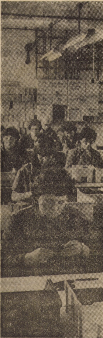
Întreprinderea „Flamura Roșie” — Sibiu a cunoscut o dezvoltare continuă și o diversificare amplă a sortimentelor care le produce. În prezent în cadrul secției articole de scris se realizează cca 35 de sortimente de creioane cu pastă și 10 creioane mecanice. În fotografie redăm o secvență de muncă de la faza montaj