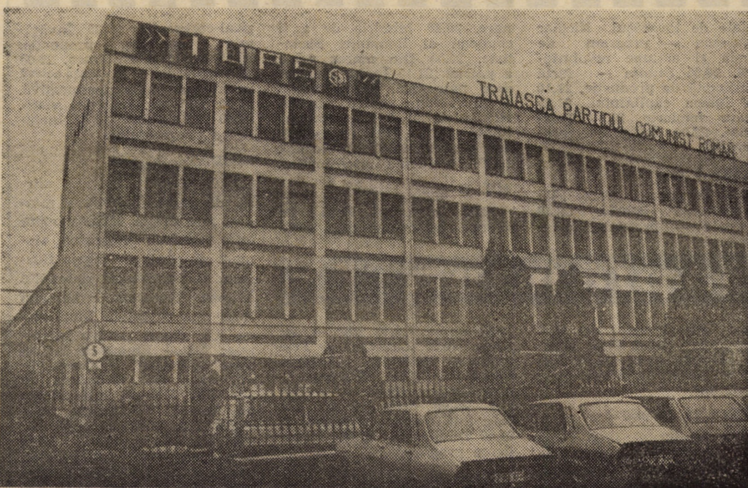
I.U.P.S. Sibiu - o unitate binecunoscută în sectoarele forestier și al materialelor de construcții, prin produsele pe care le realizează pentru acestea