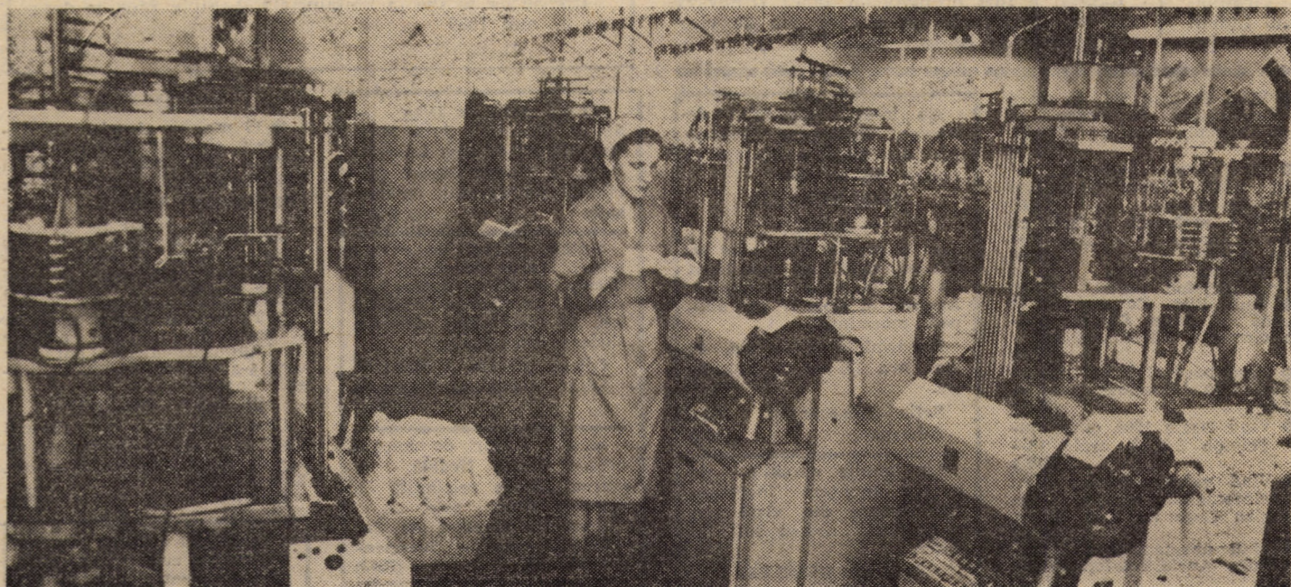
Secvență de muncă surprinsă în secția tricotațe II a Întreprinderii „7 Noiembrie” Sibiu

Centrul de Creație și Cultură „Cîntarea României” al Sindicatelor Cisnădie, mai face înscrieri, pînă la 20 mai, a.c., la următoarele cursuri și cercuri: CONTABILITATE — durata 9 luni; COAFURA — durata 6 luni; CROITORIE — durata 6 luni; DACTILOGRAFIE — durata 6 luni; CERCUB DE MUZICĂ — pian, acordeon, orgă, baterie, chitară, clarinet, taragot, saxofon — durata 9 luni. Înscrierile se fac la sediul instituției, zilnic între orele 8-16. Telefon 6 15 62.