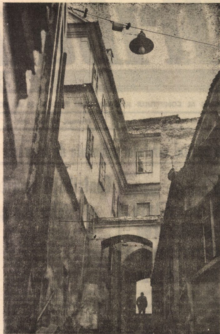
Sibiu vechi. Scările aurarilor

● Ora 18, Centrul de Creație și Cultură „Cîntarea României” Cisnădie: Dezbaterea „Etapă ale evoluției vieții pe Pămînt” (organizează Muzeul de Istorie Naturală).