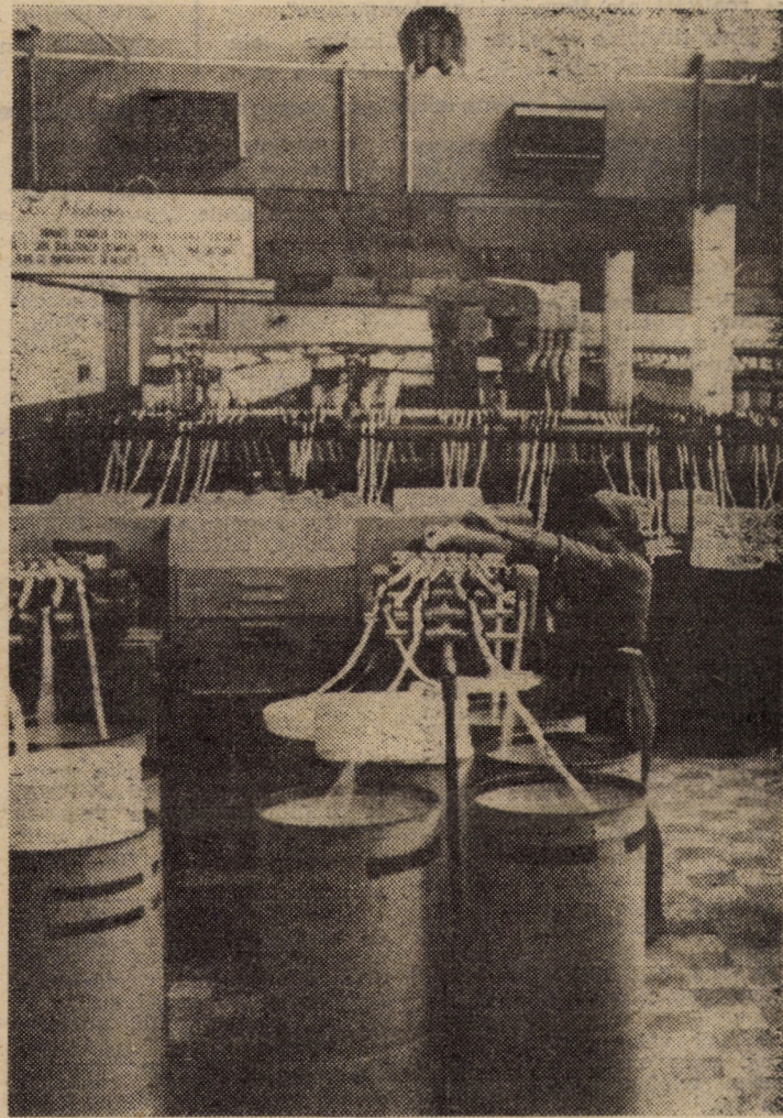
Aspect de muncă la unul din laminoarele secției filatură de la Întreprinderea „Tîrnava” Mediaș

general, pretutindeni în unități se cere a se acționa cu prioritate pentru reducerea consumurilor energetice, prin aplicarea măsurilor din programele de organizare și modernizare ce privesc introducerea unor tehnologii și soluții constructive mai economice. Și trebuie să recunoaștem în final că bilanțul energetic la care ne-am referit constituie o bună bază de plecare pentru noi și însemnate progrese pe calea reducerii consumurilor energetice, la toate categoriile de consumatori, pentru utilizarea cu maximum de eficiență a tuturor surselor și resurselor energetice.