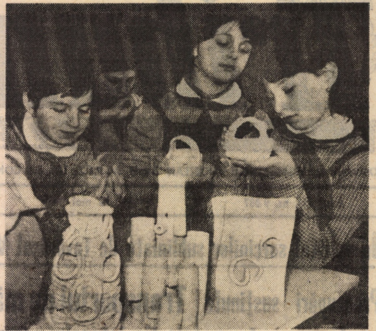
Modelarea lutului — o îndeletnicire plină de pasiune pentru cei care frecventează cercul de ceramică al Casei Pionierilor și Șoimilor Patriei Sibiu