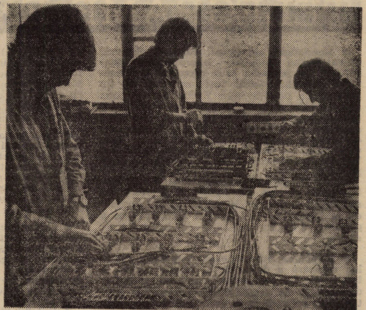
În imagine, montajul tablourilor pentru instalațiile de stabilizare a frecvenței în atelierul electric de la unitatea metal II a Intreprinderii „Flamura Roșie” Sibiu.