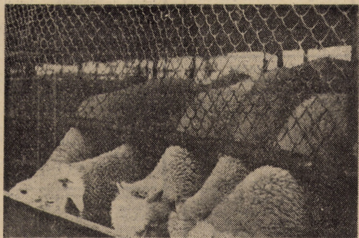
Berbecuții aflați pe tronson la îngrășătoria de la C.A.P. Alămor beneficiază de condiții optime de cazare și hrănire

mame și 3 cîrduri de tineret de prăsilă). Din relatările șefului de fermă am reținut că s-au livrat pînă în prezent 8370 kg lînă, la care se vor adăuga încă aproximativ 3000 kg de lînă-miță obținută de la berbecuții aflați la îngrășat, astfel încît planul la acest produs va fi îndeplinit. La laptele de oaie și miei există de asemenea, condiții pentru realizarea sarcinilor planificate, colectivul fermei fiind ferm hotărît să încheie acest an cu rezultate superioare la toți indicatorii, onorîndu-și astfel angajamentul asumat în adunarea generală a membrilor cooperatori.