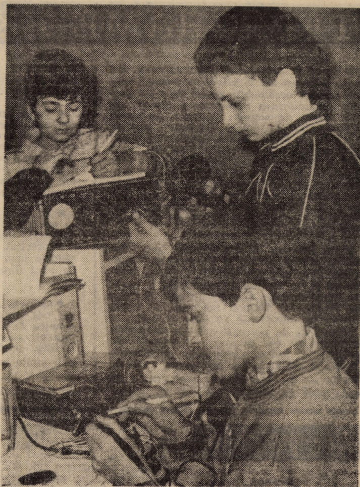
Aparate de măsură, ciocan de lipit, alimentator, rezistențe, condensatoare, tranzistoare — iată cîteva din ustensiile micilor electroniști ai cercului de automatică de la Casa Pionierilor și Șoimilor Patriei Sibiu, la care se adaugă însușirea temeinică a cunoștințelor de specialitate și... multă, multă pasiune

Întreaga problematică supusă atenției plenarei Comitetului Municipal Sibiu al P.C.R., cu activul, fiind abordată în spiritul prețioaselor indicații ale tovarășului Nicolae Ceaușescu, secretarul general al partidului, a concentrat atenția tuturor organelor și organizațiilor de partid, de masă și obștești spre necesitatea generalizării și consolidării experienței bune dobîndite în activitatea ideologică și politico-educativă de formare a omului nou, de a se face totul pentru a înlătura neajunsurile existente, astfel încît întreaga muncă de educație și cultură socialistă să devină o uriașă forță motrice, dinamizatoare și mobilizatoare în realizarea exemplară a sarcinilor economico-sociale ce revin municipiului, parte inseparabilă a dezvoltării județului Sibiu, a patriei noastre.