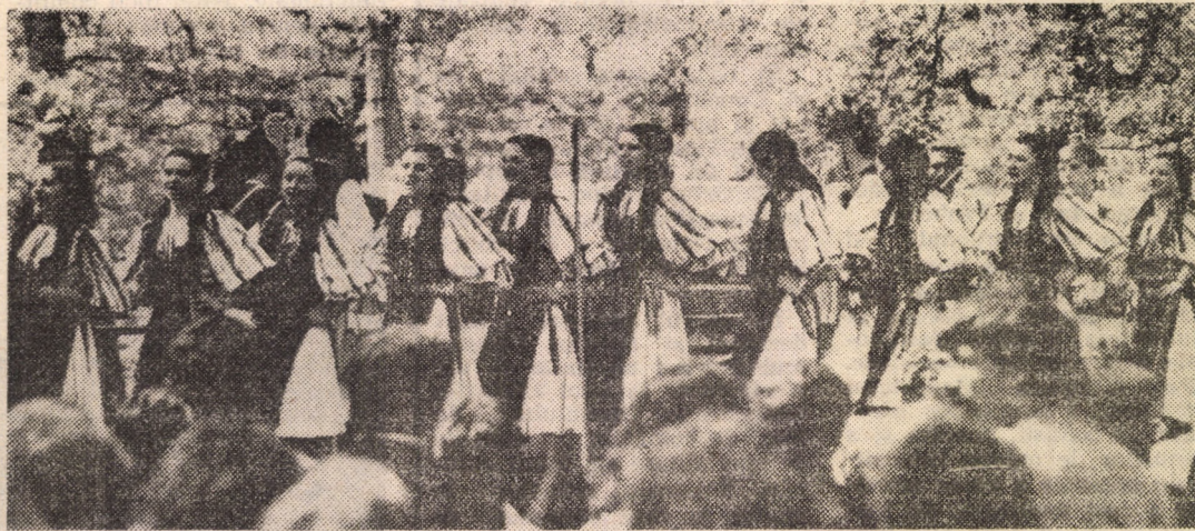
Ansamblul de cintece și dansuri al Clubului sindicatului „Independența” Sibiu, o prezență agreabilă pe scenele sibiene