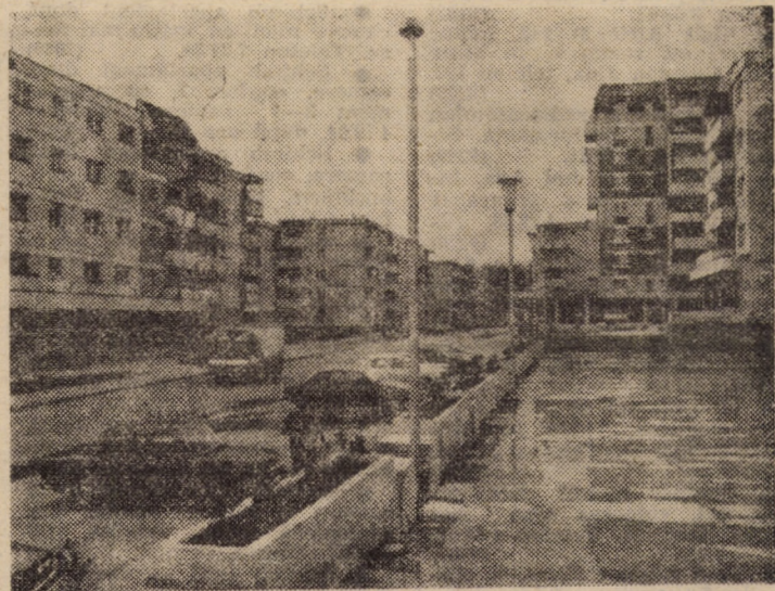
Imagine din centrul cartierului sibian „Valea Aurie”

* Anexele se vor comunica unităților interesate.