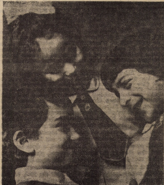
Săgalnice clipe, în zbor rostit după FRUMUȘETEA perpetuă a virstei vîlstarului, priviri limpezi adumbrînd cu curaj orice săgeată potrivnică a Timpului, căci Davăză și mamă și mamă și mamă iubitoare ni-l Patria, înălțîndu-se și înălțîndu-ne sub și spro zărl de lumină comuniste (vald.)