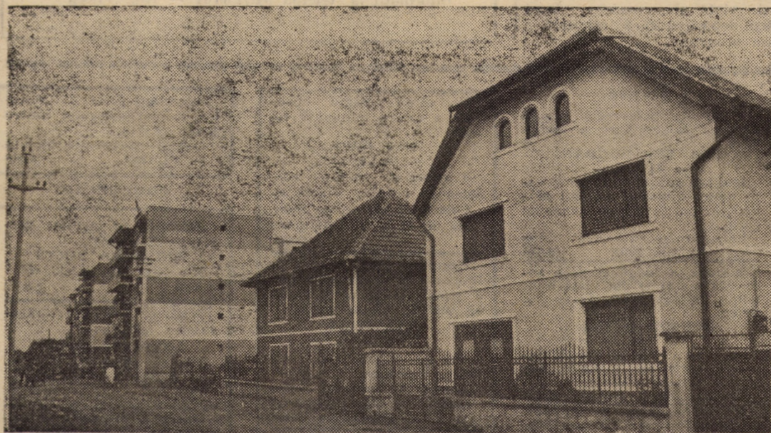
Vă prezentăm câteva dintre frumoasele construcții de locuințe din zona centrală a orașului Avrig

ÎN ÎNCHEIEREA ȘEDINȚEI A LUAT CUVÎNTUL TOVARĂȘUL NICOLAE CEAUȘESCU, SECRETAR GENERAL AL PARTIDULUI COMUNIST ROMÂN.