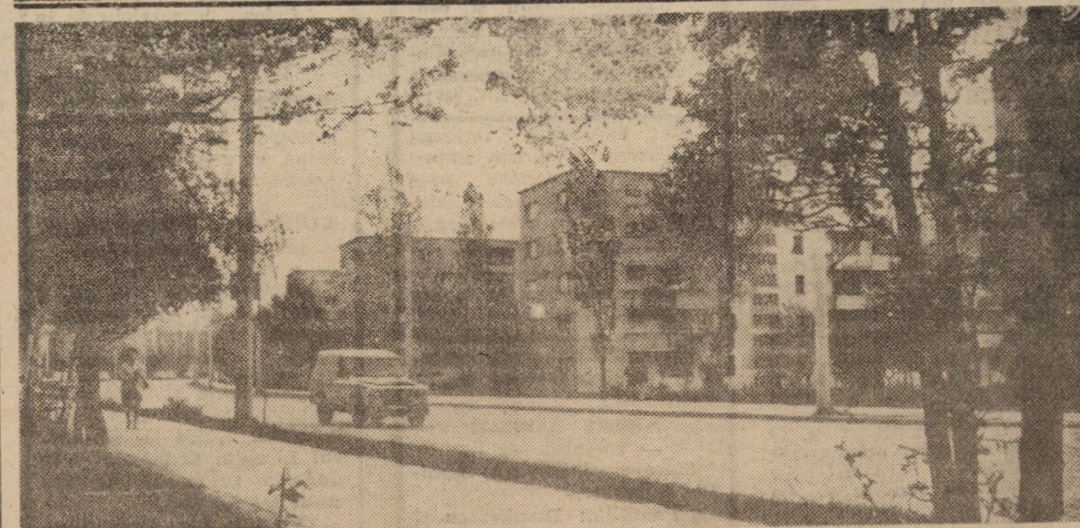
Cu aparatul de fotografiat prin cartierele sibiene de locuințe: str. Rahovei, Hipodrom

Începem relatarea noastră de la I.A.S. Slimnic notînd faptul că s-au finalizat practic pregătirile pentru declanșarea campaniei de seceriș pe cele 100 ha și 350 ha cultivate cu orz și, respectiv, cu grâu, în prezent continuîndu-se demersurile pentru asigurarea întregului necesar de piese de schimb pentru cele 7 combine aflate în dotare.