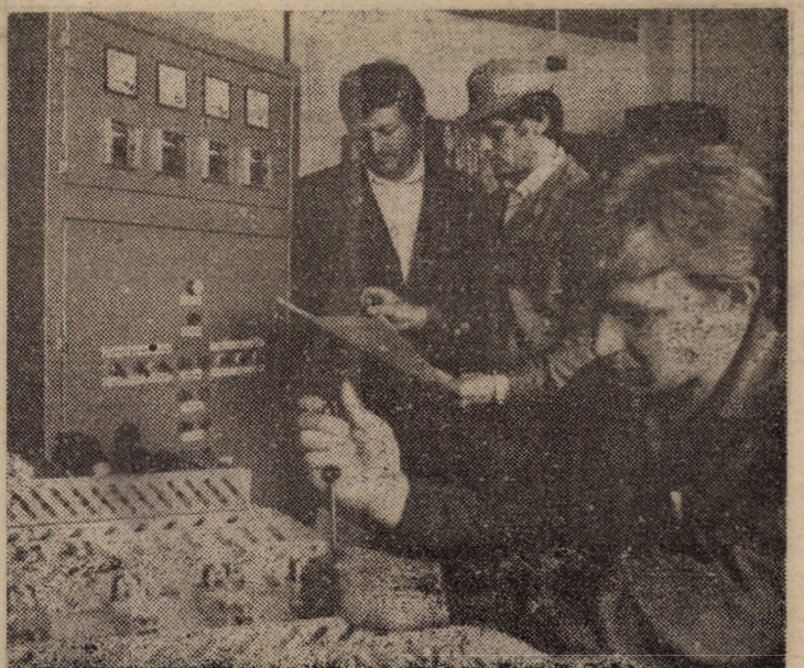
Secvență de lucru din atelierul electric al Întreprinderii „Flamura Roșie” Sibiu, la montajul unui tablou electric

Cuvîntarea a fost urmărită cu interes de cei prezenți.