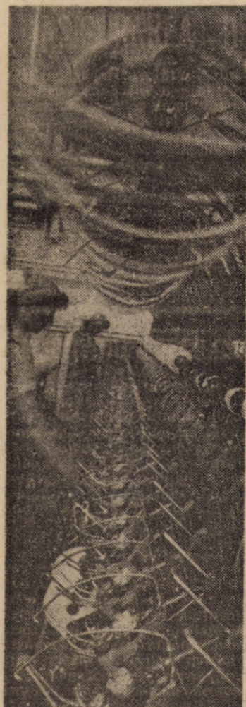
Calitatea firelor — o preocupare constantă a colectivului de muncitori de la Întreprinderea „Furul Roșu” Tâlmăciu

Montajele literar-muzicale ale Liceului Pedagogic și Liceului Industrial Nr. 7, grupul vocal-instrumental de la Centrul de Creație și Cultură Socialistă „Cîntarea României” pentru Tineret Sibiu, recitatori și interpreți folk din liceele Sibiului au semnat momente de mare emoție artistică în cadrul acestei manifestări. (O.M.)