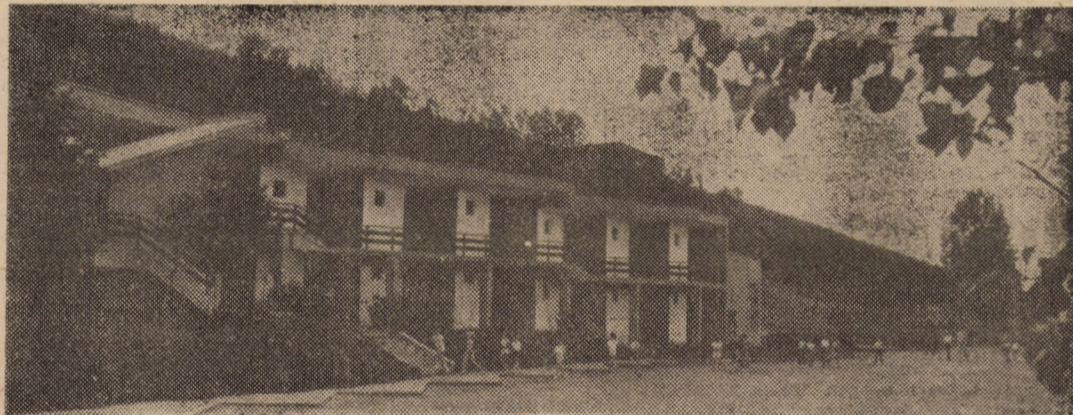
Un punct de atracție al turismului sibian: Complexul „Hanul Săliște”

Menționez în final că, urmare a preocupărilor la care ne-am referit pentru reducerea consumului de apă, prin întărirea exigenței și disciplinei în muncă la fazele de lucru consumatoare de apă, pentru următorii doi ani am stabilit o reducere a consumului de apă pentru întreprinderea noastră cu 11,6 la sută față de acest an.