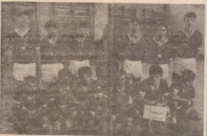
Tinerii handbaliști de la Liceul Industrial Nr. 6 Sibiu în posesia mult râvnitului trofeu