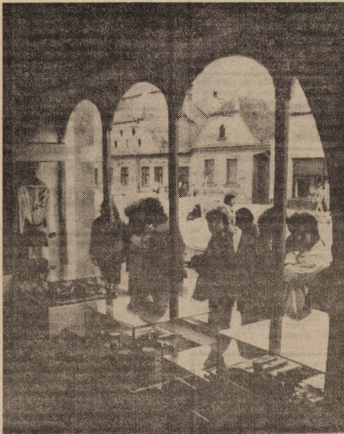
Galeriile de artă recent deschise în municipiul Mediaș

ducției. Colectivul de oameni ai muncii este mobilizat exemplar pentru a recupera grabnic restanțele din lunile anterioare, pentru a înscrie realizările întreprinderii noastre pe coordonatele stabilite prin plan“.