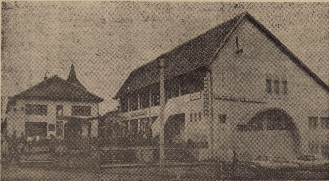
Imagine din centrul localității Avrig, recent declarată oraș