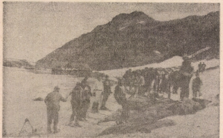
Baby-liftul instalat în Căldarea Bîlîi este un ajutor prețios în antrenamentele schiorilor