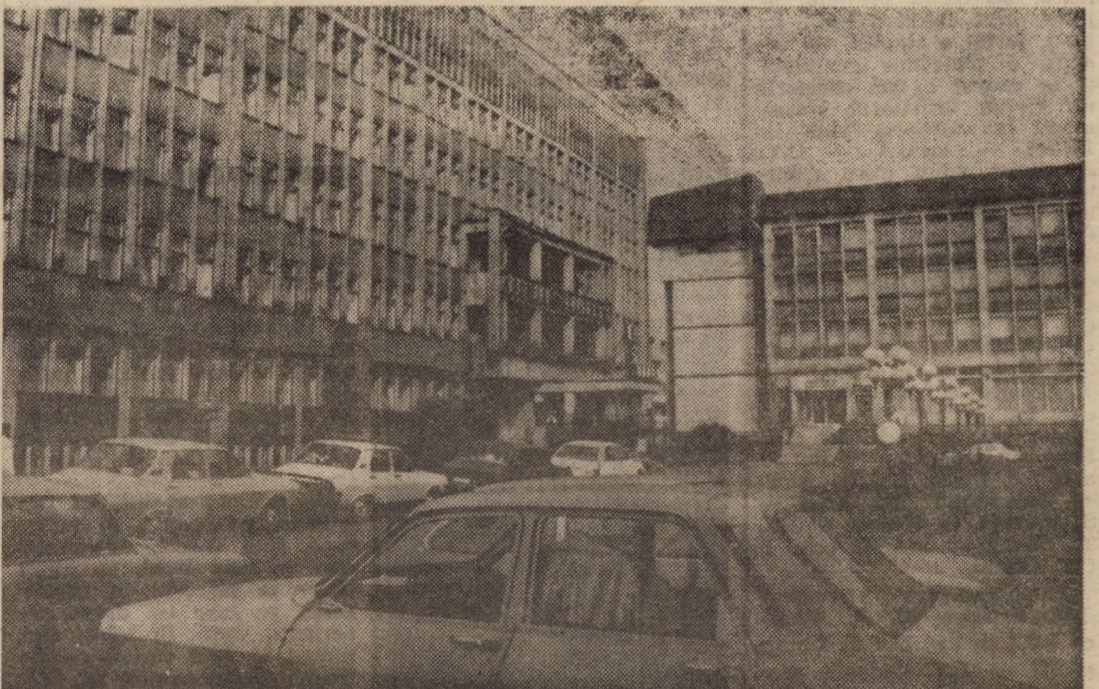
Imaginea din centrul municipiului Mediaș