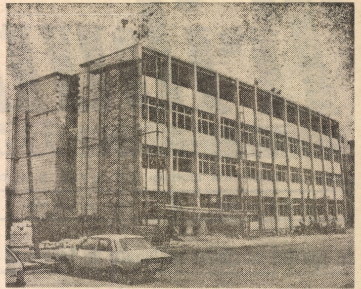
La noua școală din cartierul sibian „Strand” constructorii de la I.A.C.M. Sibiu fac eforturi pentru a preda obiectivul la termenul stabilit

— Categoriec nu. Oricare medic, oricît de bun ar fi, nu poate să obțină succese deosebite fără o colaborare foarte bună cu ceilalți colegi și cu întreg personalul spitalului. Iată de ce, aș dori să aduc aici mulțumirile mele tuturor celor care au fost și sînt alături de mine în nobla și frumoasa luptă pentru salvarea vieții. În medicină, suc-