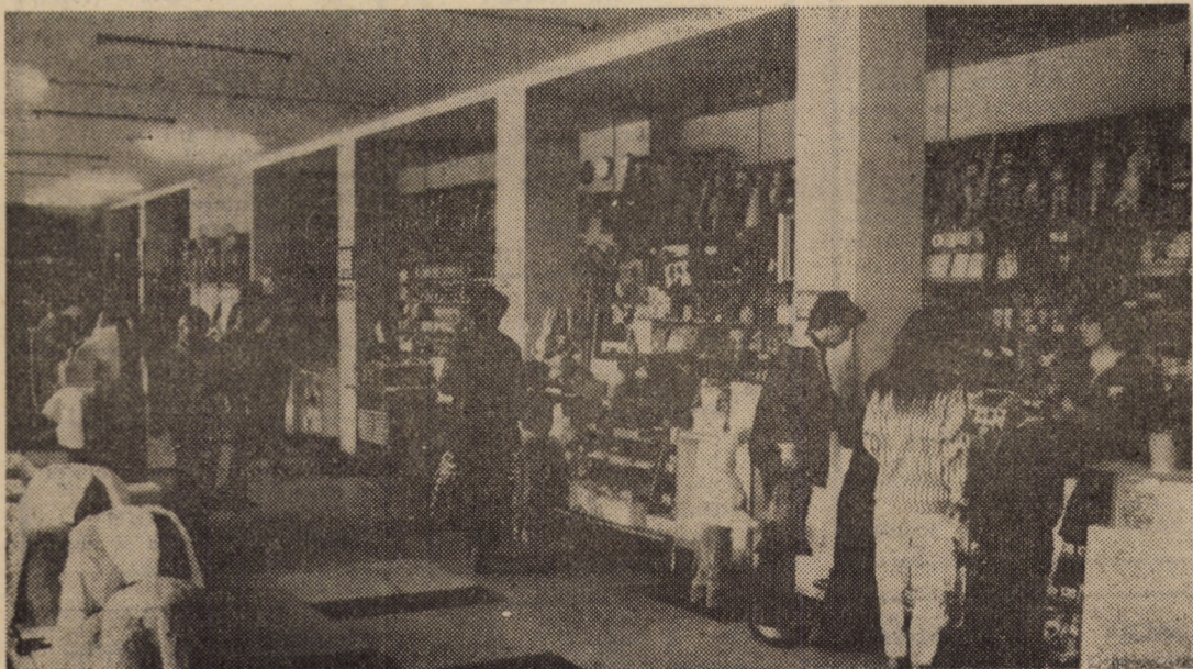
Magazinul universal „Victoria” din Cisnădie — o unitate comercială de prestigiu în orașul textilistilor