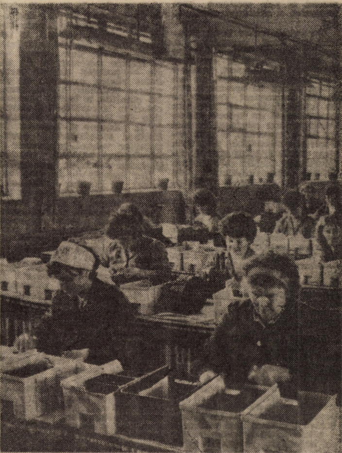
„Flaro” Sibiu. Imagine de la faza de montaj a articolelor pentru scris