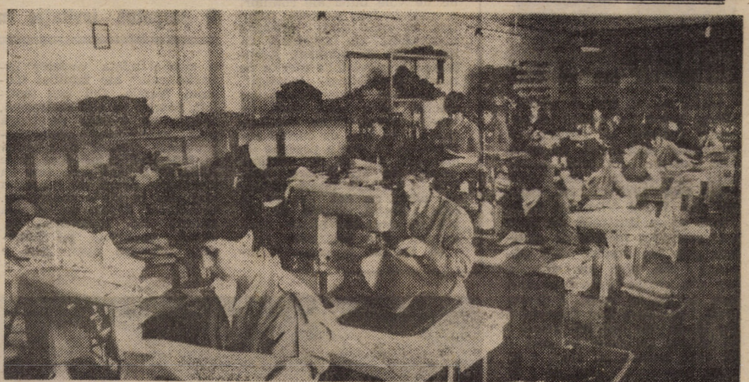
Una din unitățile moderne pentru confecționat articole de marochinărie: Unitatea nr. 15, aparținînd Cooperativei „Gheata” din Sibiu.