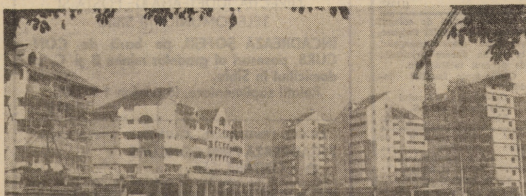
Impozante construcții de locuințe, parțial finite, unele cu parter comercial, ridicate pe str. N. Teclu din Sibiu

După cum ne-a informat șeful Fermei nr. 2 Șeica Mică, Ion Ivan, în perimetrul căreia se află parcela menționată, toți participanții la campanie sînt hotărâți să muncească exemplar, pentru ca nimic din recolta deosebit de bună a acestui an să nu se piardă, iar directorul unității, Nicolae Toleciu, ne-a asigurat că secerișul va fi încheiat integral pînă la mijlocul săptămînii viitoare. În altă ordine de idei, semnalăm ritmul foarte bun la eliberatul terenului, cele 4 prese de balotat din dotare acționînd la strînsul paielor de grâu pe terenurile Fermei nr. 1 Șorostin. Pînă în ziua rîndului nostru, au fost eliberate de paie peste 30 ha cultivate cu grâu, ceea ce a permis trecerea la executarea arăturilor pentru înfrîntarea culturilor duble.