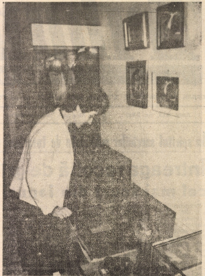
Din frumoasele interioare ale Galeriei de Artă, aparținînd filialei U.A.P. Sibiu, recent deschisă în municipiul Mediaș

la aceeași oră, va întâlni echipa A.S.A. Tg. Mureș (adversarul anunțat anterior — F.C.M. Brașov — nu mai poate face deplasarea la Sibiu).