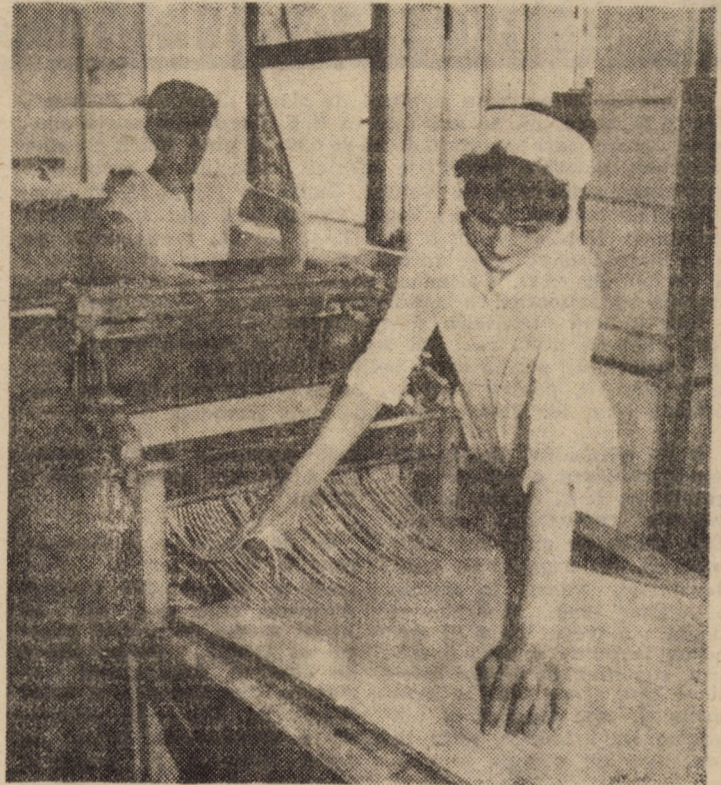
Faza de laminare a sticksurilor din cadrul noii capacități de producție de la I.O.M.COOP. Sibiu

În vederea atingerii, la orizontul anului 2000, a stadiului de țară dezvoltată din punct de vedere economic, în deceniul următor se va accentua procesul de dezvoltare intensivă a forțelor de producție, concomitent cu intensificarea mutațiilor structurale la nivelul economiei naționale, prin potențarea ramurilor de vîrf, prin înfăptuirea noii revoluții agrare, prin amplificarea rolului științei și învățământului ca factori revoluționari ai inovațiilor, prin sistematizarea și modernizarea localităților, creșterea puternică a calității vieții.