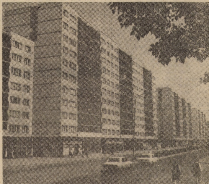
Cartierul Hipodrom din municipiul Sibiu — o mărturie eloquentă a realizărilor din anii „Epocii Nicolae Ceaușescu”

Aldin Saeed, redactor șef al ziarului irakian „Al-Irak”. Cu acest prilej, tovarășul Nicolae Ceaușescu a acordat un interviu pentru ziarul „Al-Irak”.