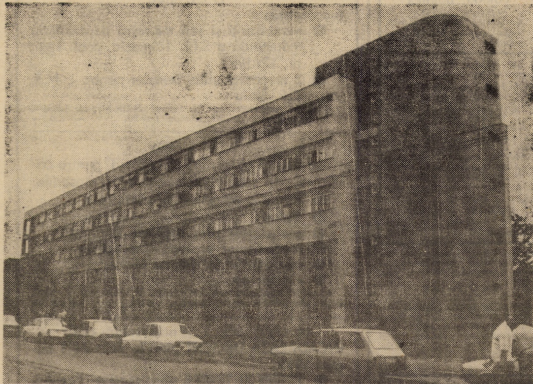
Unul din noile obiective social-edilitare ridicate în municipiul nostru: Spitalul Județean Sibiu

În încheierea festivității, participanții au adoptat textul unei telegrame adresate conducerii superioare de partid și de stat, tovarășului Nicolae Ceaușescu, secretar general al partidului.