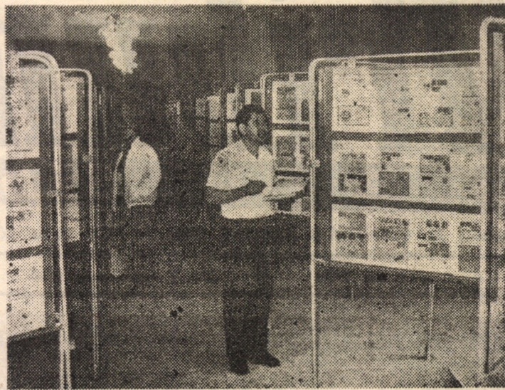
Expoziția „Aeromfila '89“