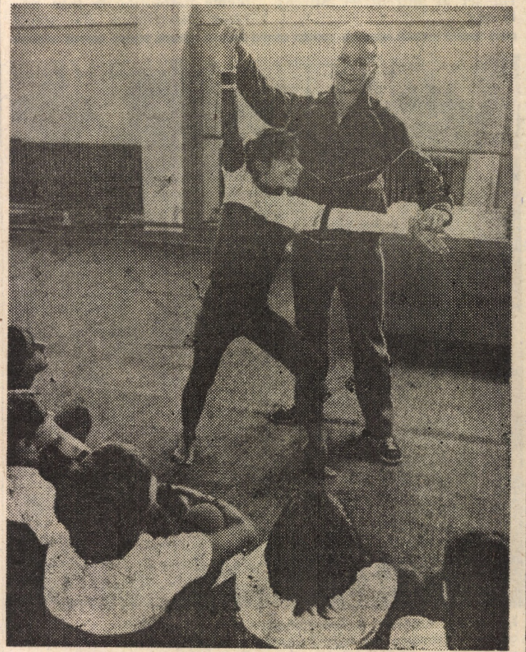
La C.S.S. Sibiu, creșterii viitoarelor stele ale gimnasticii noastre i se acordă atenția cuvenită. Iată o imagine de la un recent antrenament, cu participarea celor mai tinere sportive

21,50 Telegazeta. 22,00 Închiderea programului. Vineri, 15 septembrie 19,00 Telegazeta. 19,40 Învățămînt — cercetare — producție (c). 20,00 A munci, a învăța, a cerceta (c). 20,40 Construcția de locuințe (c). 21,00 România în lume (c). 21,20 Repartizarea optimă a veniturii naționale pentru consum și acumulare. 21,40 Telegazeta. 22,00 Închiderea programului. Simbătă, 16 septembrie 13,00 Telex. 13,05 La sfîrșit de săptămîna (c). 14,45 Săptămîna politică. 15,00 Închiderea programului. 19,00 Telegazeta. 19,25 Sub tricolor, sub roșu steag (c). 19,40 Teleenciclopedie (c). 20,10 Concurs de creație și interpretare de muzică ușoară românească — Mamaia '89 (c). 20,55 Film artistic (c). „Iarba verde de acasă”. 22,20 Telegazeta. 22,30 Închiderea programului.