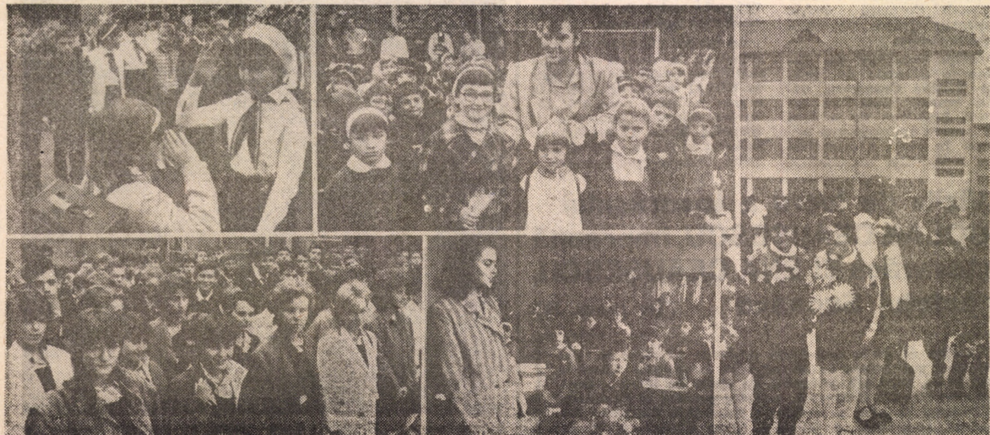
Momente emoționante și de intensă trăire prilejuite de deschiderea noului an școlar

În rețeaua învățămîntului din mediul rural avem bucuria să anunțăm intrarea în funcțiune a încă unei școli — școala din comuna Laslea — de fapt o clădire nouă, care se adaugă celei existente. Aceasta, realizată în mare parte prin contribuția cetățenilor, se compune din 8 săli de clasă, o sală de gimnastică, un laborator, sală profesorală, direcțiune și alte anexe necesare unui astfel de edificiu. Aici vor învăța peste 200 de elevi din clasele V—X, avînd la dispoziție condiții materiale optime — spațiu, mobilier, material didactic, aparatură etc. — și, desigur, cadre didactice bine pregătite. Așadar, succese noi, în școală nouă! (T. S.)