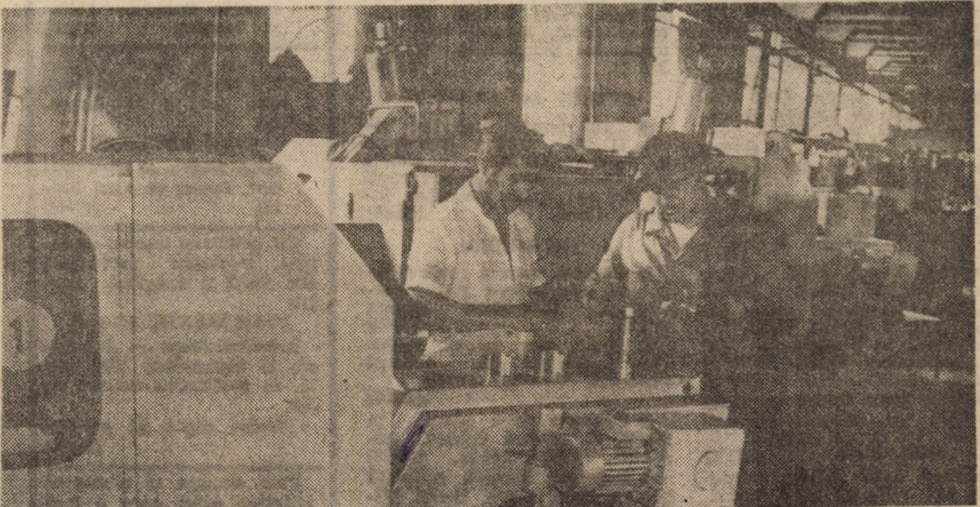
Intreprinderea „Independența” Sibiu. La linia de strunguri revolver cu ureauă verticală se execută diferite componente pentru unelte pneumatice. Performanțele utilajelor permit executarea unor lucrări de înaltă precizie și complexitate

Vizita de lucru a tovarășului Nicolae Ceaușescu, împreună cu tovarășa Elena Ceaușescu, în județul Suceava continuă.