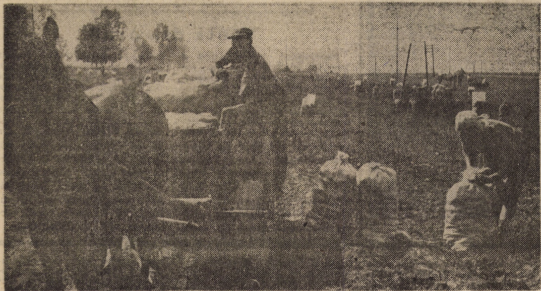
O lucrare de maximă prioritate este, în aceste zile, recoltatul cartofilor de toamnă, cultură cu o pondere importantă în județul Sibiu și, în special, în C.U.A.S.C.-ul Avrig. În vederea măririi ritmului de lucru se cere folosirea din plin întreaga forță umană de pe raza localităților respective, iar la transport trebuie cuprinse toate atelajele unităților agricole și ale locuitorilor satelor. În imagine, un aspect de muncă de la C.A.P. Porumbacu de Jos, unitate care dispune de o suprafață de 169 ha cultivate cu cartofi.

● Au mai fost executate reparații la învelitori în suprafață de 2 150 m.p., înlocuiri de jgheaburi, reparații de pardoseli, binate, coșuri și altele. De menționat că valoarea lucrărilor, la capitolul reparații și întreținere fond locativ realizate în semestrul I, a fost de 1 476 mii lei, cu o depășire a planului anual în proporție de 46 la sută. Vasile MIUȚA