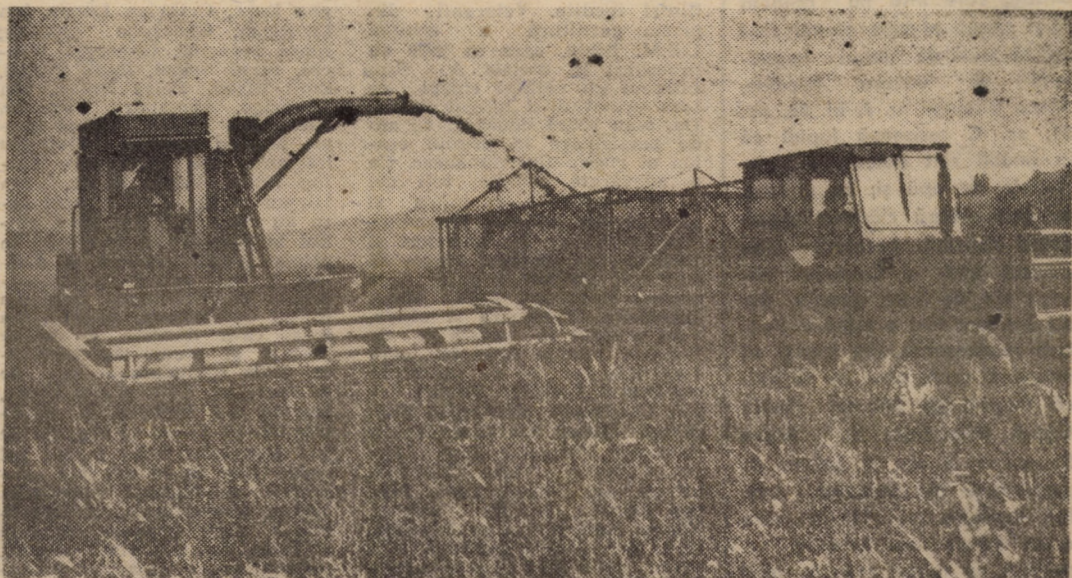
La C.A.P. Cornăeș, în terenul denumit „Iulă” se recoltează o mare cantitate de masă verde pentru siloz