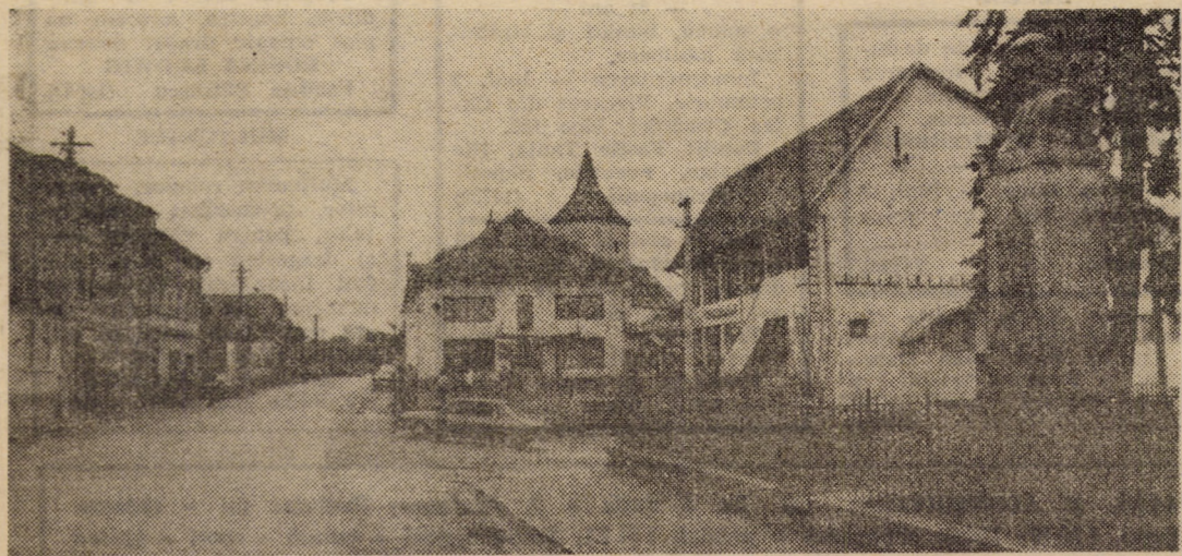
O recentă imagine din centrul Avrigului, localitate devenită oraș în cursul acestui an