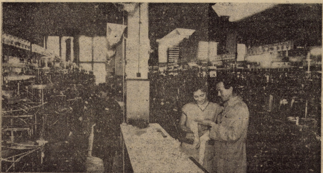
Întreprinderea „7 Noiembrie” Sibiu. În imagine vă prezentăm mașinile circulare de tricotat cu 2 cilindri.