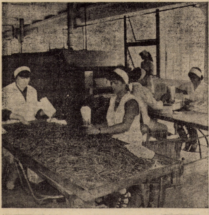
În cadrul noului laborator de cofetărie-patiserie al IOMCOOP Sibiu a fost pusă în funcțiune o linie de fabricație a sticsurilor

În funcția de secretar al Comitetului de partid a fost reales tovarășul Petru Bădilă.