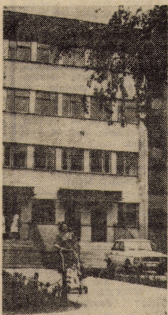
Printre alte construcții pentru ocrotirea sănătății din municipiul și județul Sibiu figurează și Spitalul de neuropsihiatrie din localitate, de unde vă redăm această vedere parțială.

Așadar, la Întreprinderea „Furul Roșu” Tâlmăciu examenul răspunderii comuniste pentru calitatea muncii, pentru calitatea oamenilor, tinde să devină tot mai mult un examen al faptelor, al competențelor, al spiritului revoluționar viu, militant, combativ.