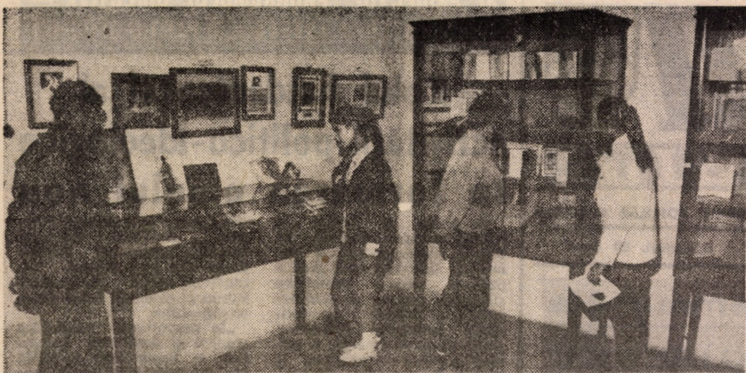
Seventă surprinsă în timpul unei vizite la Muzeul sătesc din comuna Cîrțoara, în încăperea în care se păstrează diferite obiecte, documente ale vremii și cărți care au aparținut lui Badea Cîrțan