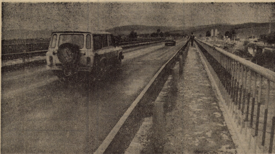
Noul pod de la Bradu peste riul Olt — obiectiv recent dat în funcțiune în județul nostru

Aceste realizări au condus la obținerea unor creșteri ale producției-marfă și exportului, la înregistrarea de noi succese pe linia dezvoltării în profil teritorial.