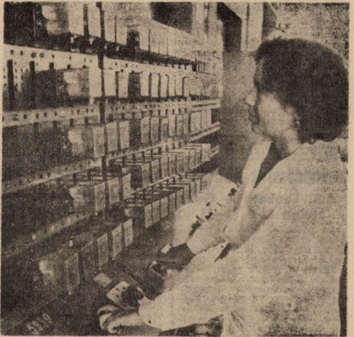
Întreprinderea de Relee Medias. Stand de rodaj pentru releele intermediare RI-10, folosite la panourile de automatizări