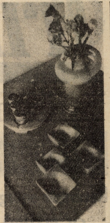
Ceramică la Galeria de artă, deschisă în municipiul Medias.

re). Mîrșenii, pregătiți de maestrul sportului Marian Zamfir, regretă neprezența adversarului, ei putînd să-și rotunjească eșaverajul. Totuși, această victorie la „masa verde” îi menține în lupta cu Agronomia Cluj-Napoca pentru „șefia” seriei A IV-a. (G. DEAC)