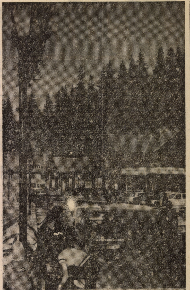
Centrul stațiunii climatice Păltiniș

Manifestările artistice — aici nu putem să nu amintim spectacolul reputatului colectiv al Teatrului Muncitoresc — au completat fericit un program ce a reprezentat un eficient demers politico-educativ și cultural-artistic. Octavian RUSU