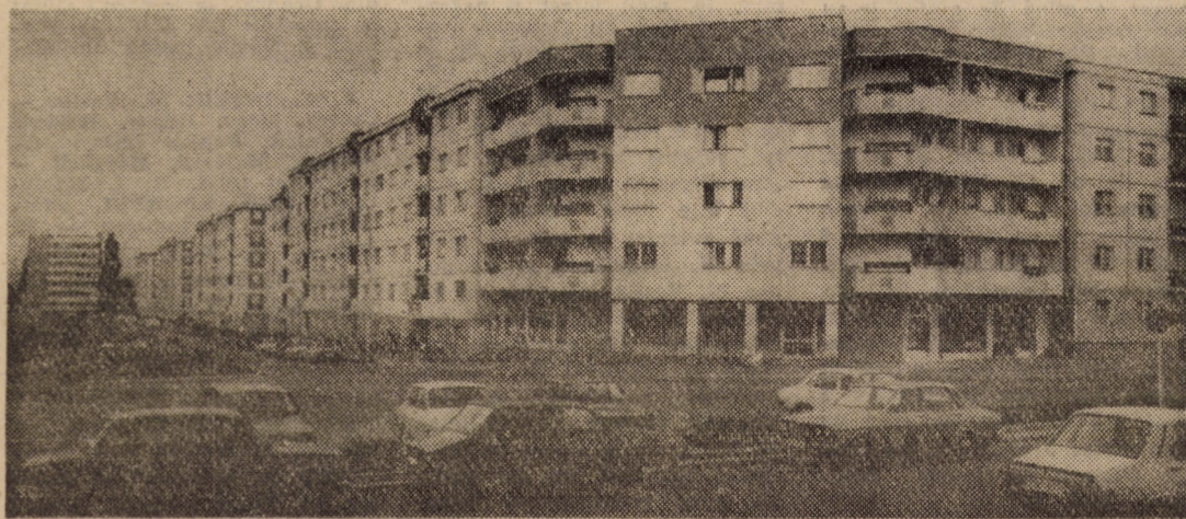
În anii de glorie, inaugurați de istoricul Congres al IX-lea al partidului, municipiul Sibiu a cunoscut un amplu proces de înnoire și modernizare. Vă prezentăm noile construcții edilitare de pe str. Școala de înot din localitate