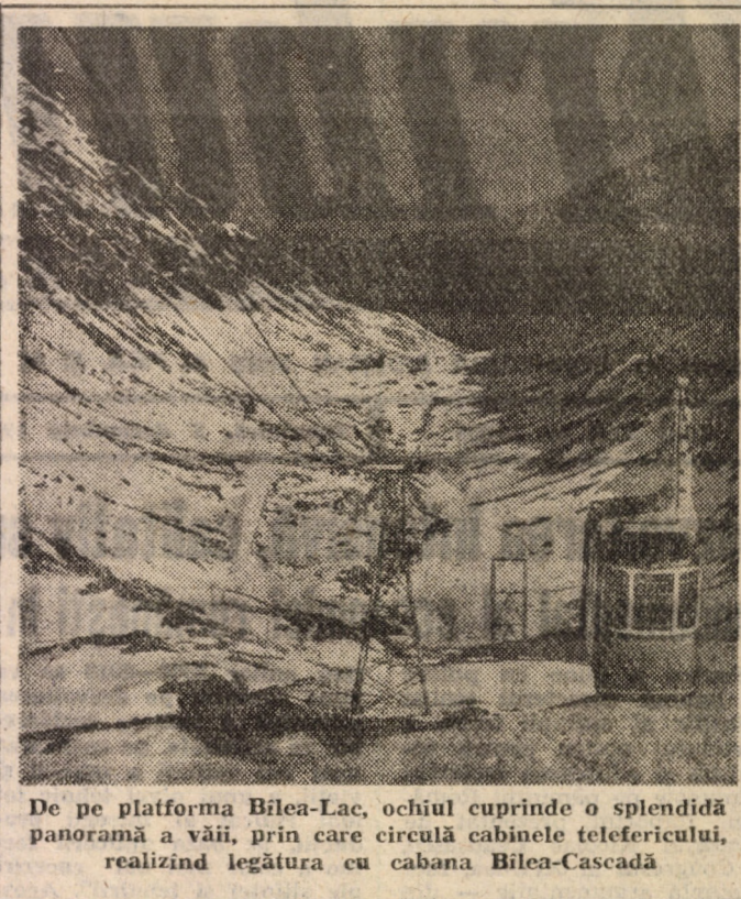
De pe platforma Bilea-Lac, ochiul cuprinde o splendidă panoramă a văii, prin care circulă cabinele telefericului, realizînd legătura cu cabana Bilea-Cascadă.