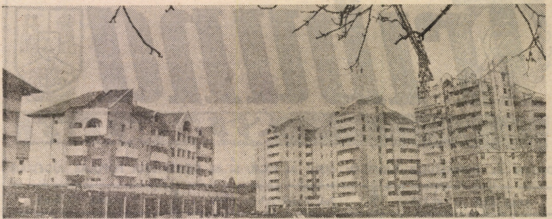
Ansamblul noilor construcții din perimetrul gării — o elocventă mărturie a înnoirilor petrecute în anii „Epocii Nicolae Ceaușescu” în municipiul Sibiu