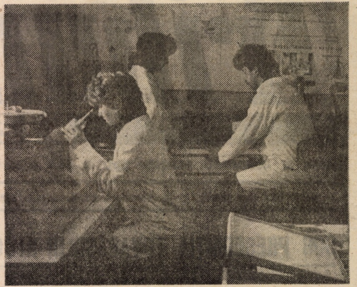
Imagine surprinsă într-unul din laboratoarele moderne utilizate ale Institutului de Subingineri Sibiu

ideea că roadele acestei pasiuni sînt, după cum se va vedea, de toată lauda: • în acest an s-a împlinit o jumătate de secol de la prima expoziție filatelică organizată în municipiu, dar începuturile acestei activități se cer împinse cu încă vreo 25 de ani înainte de prima expoziție • Cercul filatelic medieșean își are data nașterii în 14 septembrie 1958 • Treptat, beneficiind de sprijin local precum și din partea Filialei Sibiu a A.F.R., cercul medieșean și-a lărgit rîndurile, creîndu-și o bună bază materială pentru expoziții, și-a format un colectiv de exponanți și îndrumători • Din anii 70, această activitate își înscrie