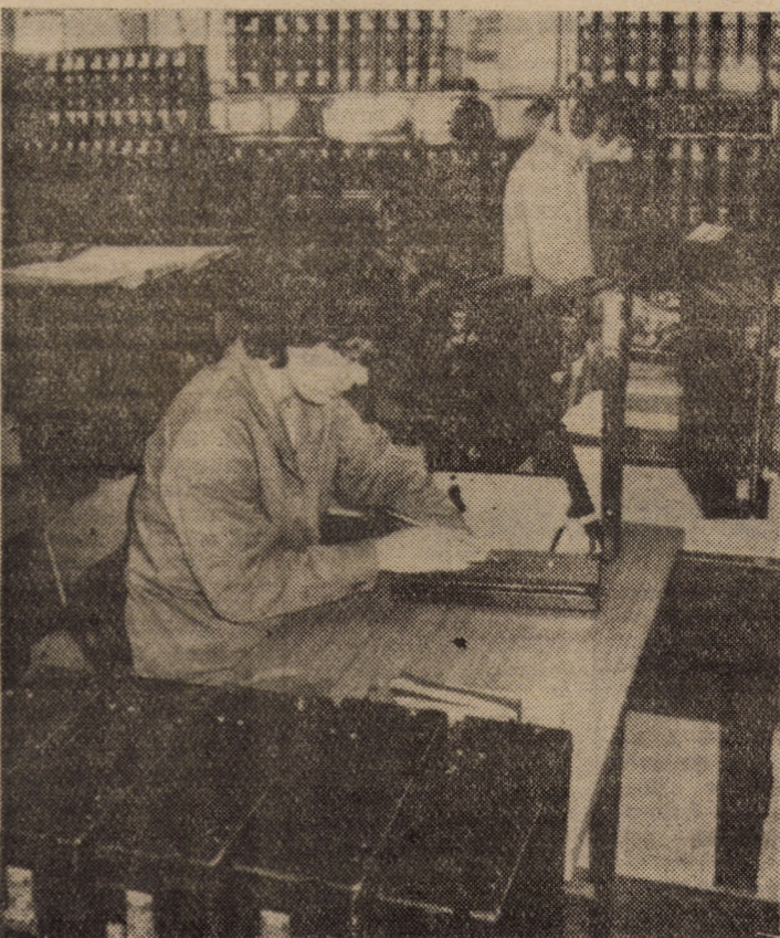
În atelierul marochinăriei piele al întreprinderii „13 Decembrie” Sibiu, întregul colectiv, toate formațiile de lucru ale acestui compartiment acordă o deosebită atenție calității produselor, situîndu-se printre colectivele de muncă fruntașe pe întreprindere.