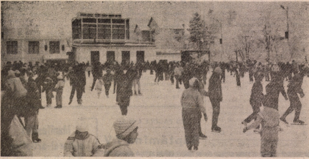
O invitație pentru toate vîrstele — s-a deschis patinoarul artificial din Sibiu.