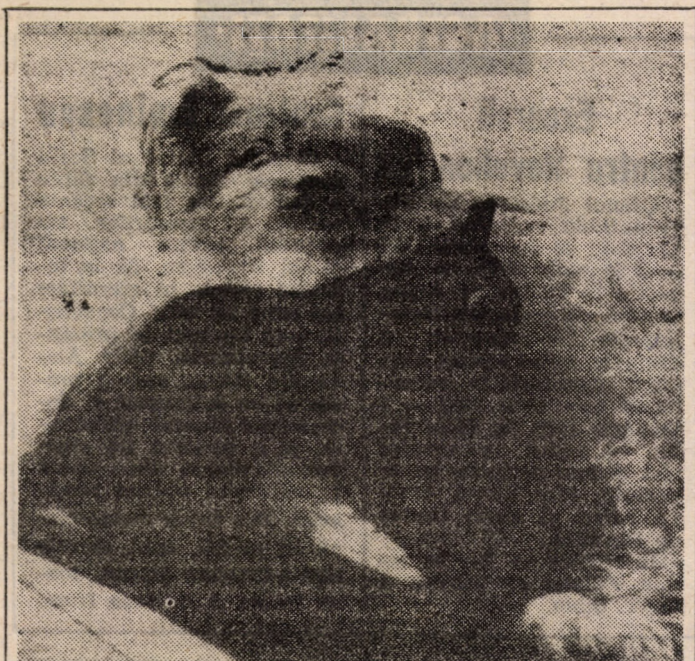
Mielul care, lapte bînd De la două oi, pe rînd L-a-ndemnat pe Motănel, Să procedeze la fel!