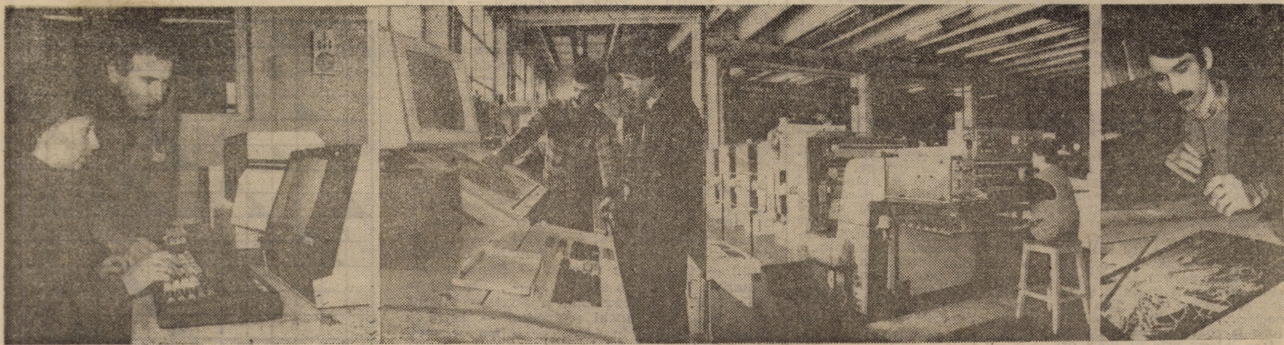
Cîteva aspecte din secțiile de producție ale Întreprinderii Poligrafice Sibiu