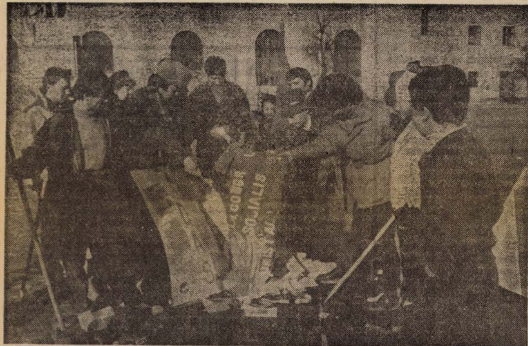
Ard imbecilele sloganuri propagandistice ale dictaturii ceaușiste. Cenușa lor, ducă-se în patru vînturi odată pentru totdeauna

Un gând pios pentru Martirii noștri. Trăiască România liberă”.