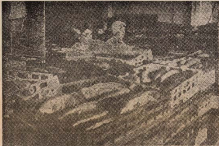
Pentru ca viața liberă să curgă cotidian, riu limpede al demnității greu regăsite, și cei ce pregătesc pîinea cea de toate zilele sînt permanent la posturi

Intrucît asemenea obiecte și piese de instrumentar al torturii au mai fost găsite și luate de cetățeni, apelăm la cei în cauză să le predea la sediul Consiliului Județean al Frontului de Salvare Națională căci pot constitui piese într-un viitor muzeu al metodologiei și al „științei” torturii. Un muzeu acuzator, ca un memento și un îndemn perpetuu la vigilență, pentru ca niciodată poporul să nu mai permită instaurarea unor asemenea odioase vremuri și circumstanțe!