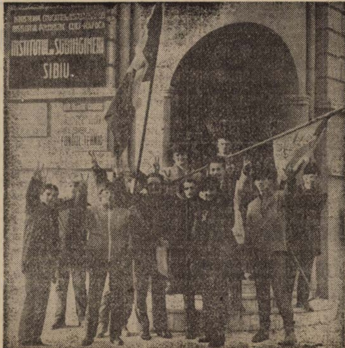
Victorie! Victorie la capătul unor lupte și sacrificii pe care tinerii Sibiului și le-au asumat cu eroism

De ce tinerii români erau urgiși să nu poată călători în țările „bătrînului continent”, deși au învățat cu sîrguință limbile străine moderne? Pentru cei mai mulți dintre ei, nici anii care aveau să urmeze nu