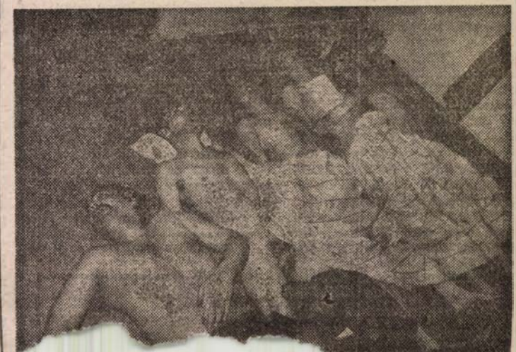
Orătoare făptuite pe rîniști fanatici aflați în luptă ieri la