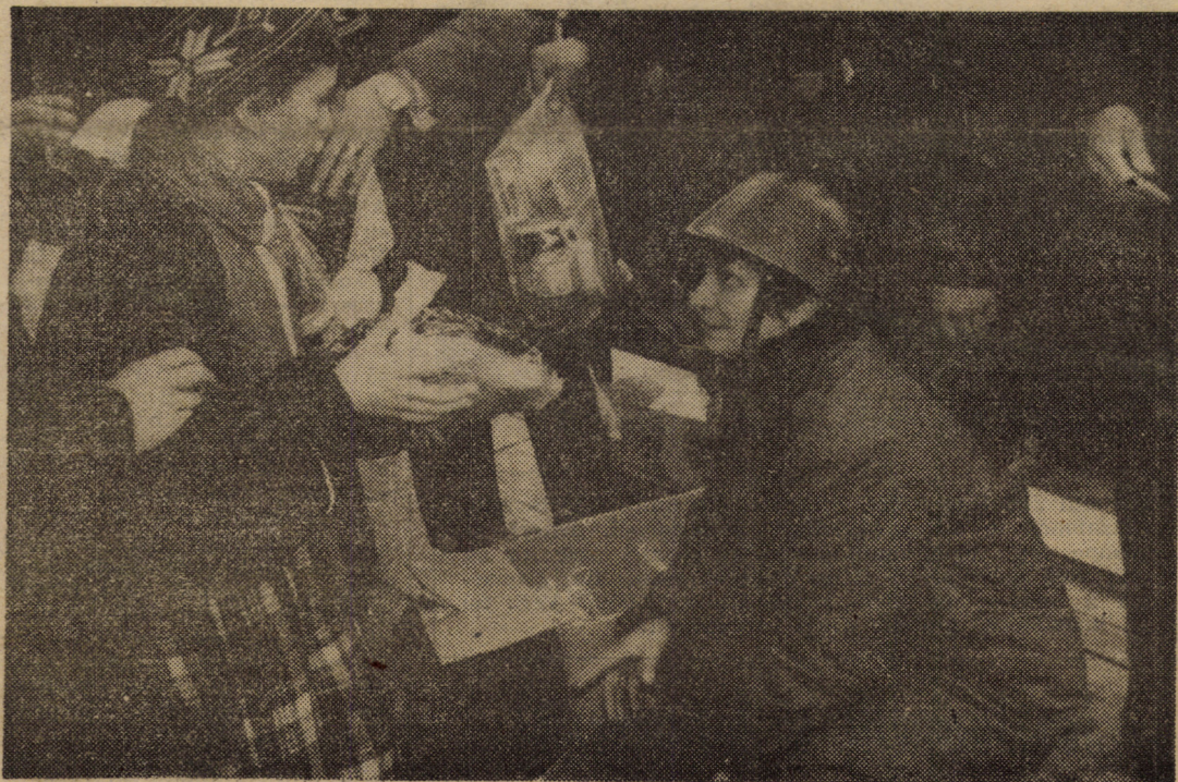
Pilduitoarea fraternitate dintre ostași și popor este demonstrată și de această imagine în care militarii oferă copiilor daruri...

● Cîteva noutăți de la D.J.P.Tc. Sibiu. Pentru a vorbi telefonic cu străinătatea, vă puteți adresa serviciului internațional la numărul 071 (foarte solicitat în aceste zile). Conducerea direcției ne-a informat ieri că în două-trei zile se va pune în funcțiune un circuit direct cu orașul Frankfurt pe Main din R.F.G., prin intermediul căruia se va putea vorbi mult mai operativ cu orice localitate din țara respectivă.