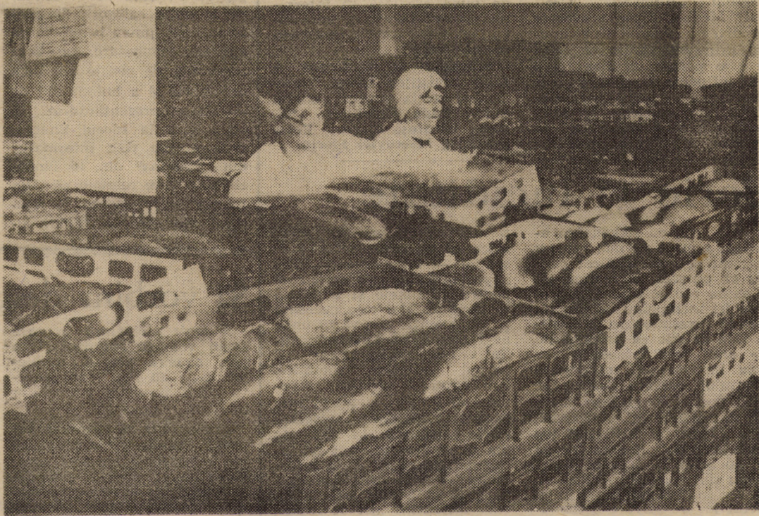
Prin eforturile lucrătorilor de la Întreprinderea de Morărit și Panificație aprovizionarea cu pine este satisfăcătoare. Pe cînd se va putea spune același lucru și despre celelalte produse alimentare?