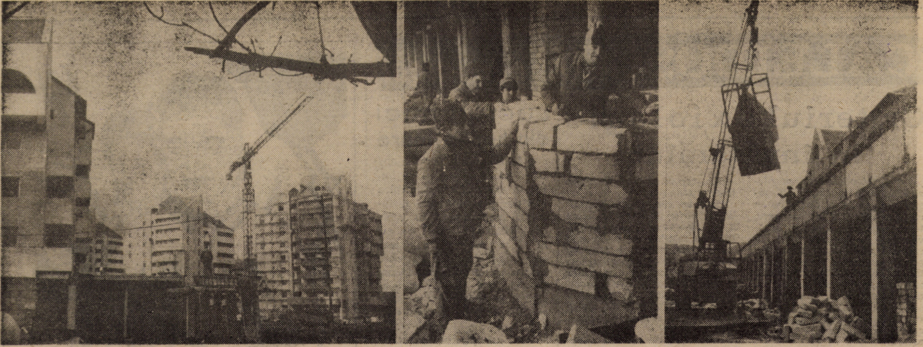
Imagini tonifiante, care certifică eforturile de intrare în normal a activității economice într-un sector fierbinte — construcțiile de locuințe