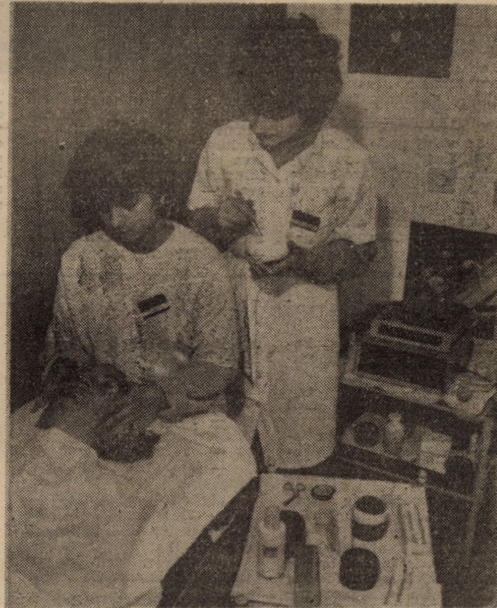
DACĂ VĂ INTERESEAZĂ: Recent, în cadrul unității 48 a Cooperativei „Igiena” din cartierul „Valea Aurie” Sibiu, a fost redeschis un salon de cosmetică unde clientela beneficiază de servicii calificate